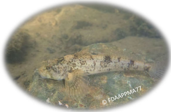
Chabot fluvial, espèce d'intérêt communautaire du site Natura 2000

Les quatre espèces d'intérêt communautaire (chabot fluvial, lamproie de Planer, bouvière, loche de rivière) ont été observées sur les stations inventoriées. Les populations de chabots sur le Lunain et de bouvières sur le Loing sont très bien représentées voire surreprésentées du fait de la faible proportion de prédateurs tels que la truite ou le brochet. L'anguille européenne est également présente sur les stations mais elle se retrouve bloquée à l'aval des barrages qui bloquent leur remontée des cours d'eau. Ce phénomène d'accumulation est notamment observé sur le Loing ainsi qu'au niveau de l'ouvrage d'Episy sur le Lunain.