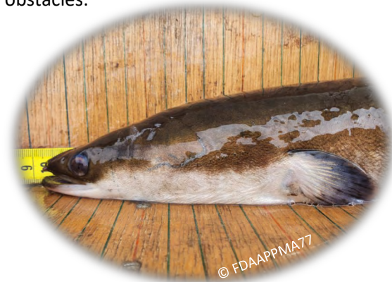
Anguille européenne au stade argentée

Les espèces piscicoles sont les premières impactées par les ouvrages présents dans les rivières. Les barrages limitent leur déplacement et particulièrement celui des espèces migratrices. Cela s'observe notamment sur les populations d'anguilles pour lesquelles on constate souvent des effets d'accumulation au pied des ouvrages. Les barrages sont également préjudiciables pour des espèces comme le brochet qui doit migrer vers ses zones de frai en période de reproduction mais qui se retrouve bloqué par différents obstacles.